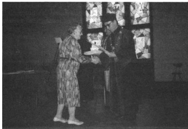
Uroczyste wręczenie dyplomu ukończenia studiów w Uniwersytecie Trzeciego Wieku