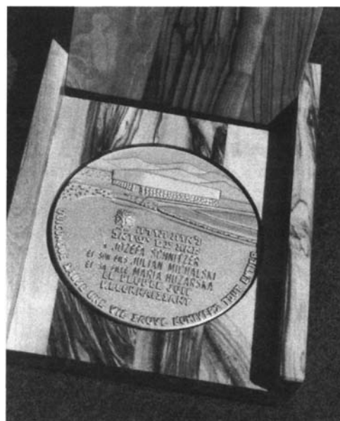
Medal "Sprawiedliwi Wśród Narodów Świata", którym uhonorowano 10 mieszkańców Dolnego Śląska