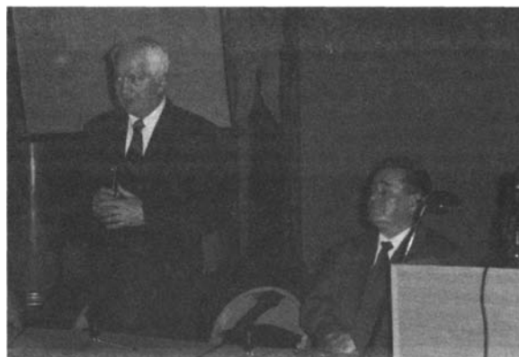
JM Rektor prof. Roman Duda otwiera obrady VIII Wrocławskiego Sympozjum Badań Pisma

W trakcie trwania sympozjum wygłoszono 40 referatów. Większość z nich dotyczyła nowej problematyki w ramach kryminalistycznych badań dokumentów. Prawie wszystkim towarzyszyła żywa dyskusja. Referaty zostaną opublikowane w "Materiałach VIII Wrocławskiego Sympozjum Badań Pisma" pod re-