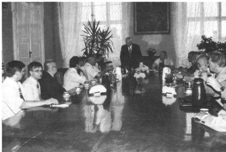
Spotkanie ministra Mirosława Handkego z Kolegium Rektorów Uczelni Wrocławia i Opola

W podsumowaniu minister Handke wyraził opinię, że projekt nowej ustawy sankcjonuje cały szereg trendów, które obserwuje się obecnie w szkolnictwie wyższym, niektóre z nich ekstrapolując, a co do niektórych notując status quo. W bardzo niewielu miejscach jest rewolucyjna, a więc zdaniem Ministra ma duże szanse na powszechną akceptację w środowisku. W ustawie tej widać doświadczenia obydwu profesorów-autorów tego projektu ustawy zdobyte przy pełnieniu funkcji rektora oraz ich przygotowanie prawnicze.