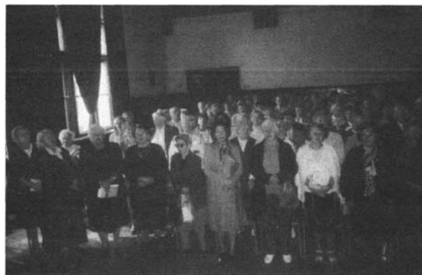
Słuchacze Uniwersytetu Trzeciego Wieku na uroczystości zakończenia roku akademickiego 1997/98