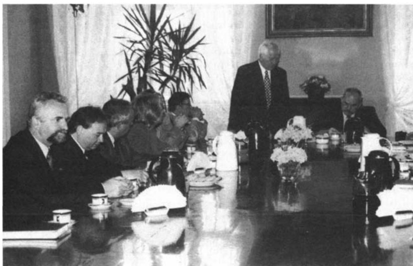
Członkowie Kolegium Rektorsko-Dziekańskiego na spotkaniu z ministrem Mirosławem Handke w sali Senatu UW.

Najbardziej zaawansowany w procesie tworzenia wydziału teologicznego jest Uniwersytet im. A. Mickiewicza w Poznaniu i Uniwersytet Gdański. W Uniwersytecie Jagiellońskim i Uniwersytecie Warszawskim nie ma tendencji do powrotu teologii, gdyż wokół obydwu dawnych wydziałów stworzyły się odrębne uniwersytety. Papieska Akademia Teologiczna w Krakowie jest samodzielną, trójwydziałową uczelnią z rozwiniętymi wydziałami historii, prawa i teologii. Podobnie jest z Akademią Teologii Katolickiej w Warszawie, która jest także dużą samodzielną szkołą wyższą.