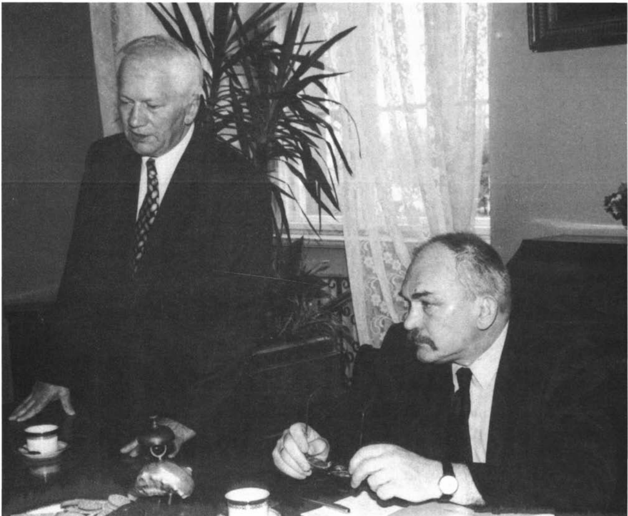
Minister Edukacji Narodowej prof. Mirosław Handke z wizytą na Uniwersytecie Wrocławskim