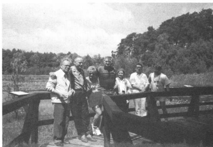
Ich Magnificencje w Olejnicy w czasie wolnym od obrad Kolegium Rektorów Uczelni Wrocławia i Opola ...